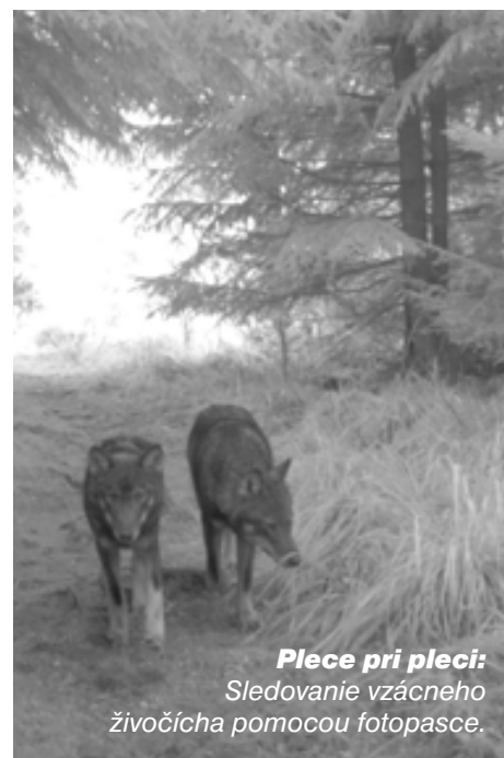
Plece pri pleci: Sledovanie vzácneho živočicha pomocou fotopasce.

Sme krajina s bohatou poľovníckou tradíciou, mnoho poľovníkov chce vlka loviť, a preto dodržiava disciplínu a zásady s tým spojené. Iba niektorým sa pošastilo ho uloviť. Ďalší mali šťastie aspoň ho zahliadnuť, ale väčšina sa s ním ani nestretla. Pri zostavovaní akčného plánu bude pomoc poľovníkov pri monitorovaní a sledovaní tohto vzácneho živočicha najdôležitejším vkladom. Je v našom záujme vytvoriť systém, ktorý pružne a dôveryhodne vyhodnotí, či v love vlka treba pridať, alebo z neho ubrať. ■